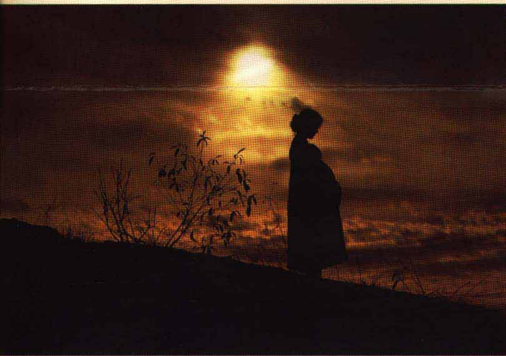
Espero que as futuras gerações desfrutem suas vidas, a Terra e a beleza do magnífico mundo e que possam descansar nas praias e sonhar. — Richard Jefferies, naturalista e escritor (1848-1887)

Nesta situação, qualquer atitude positiva tomada pelo clube e seus membros em prol de um ambiente saudável e ecologicamente mais balanceado será significativa. Não somente melhorará as vidas diárias daqueles em sua comunidade, como também as vidas de pessoas do mundo inteiro e gerações futuras. Como somos os originários do problema, devemos desempenhar um papel importante na solução do mesmo. Aproveite as reservas de energia, talentos e aptidões dos sócios de seu clube. Tome conhecimento dos problemas. Olhe ao seu redor. Divulgue o trabalho. Participe e atue.