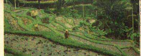
Não há nada mais esplêndido... que uma Terra onde se possa viver, trabalhar e respirar a brisa das estepes — Major Gherman Titov, cosmonauta soviético (1935-presente)